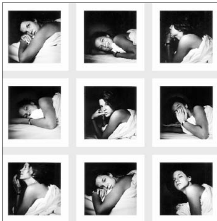
Alan Humerose, «Suites», 2001