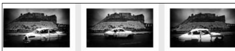
Alan Humeroze, «Suites», 2001

«Certains noirs deviennent aussi transparents que les voilages taillés dans le marbre, en Italie, à la Renaissance.»